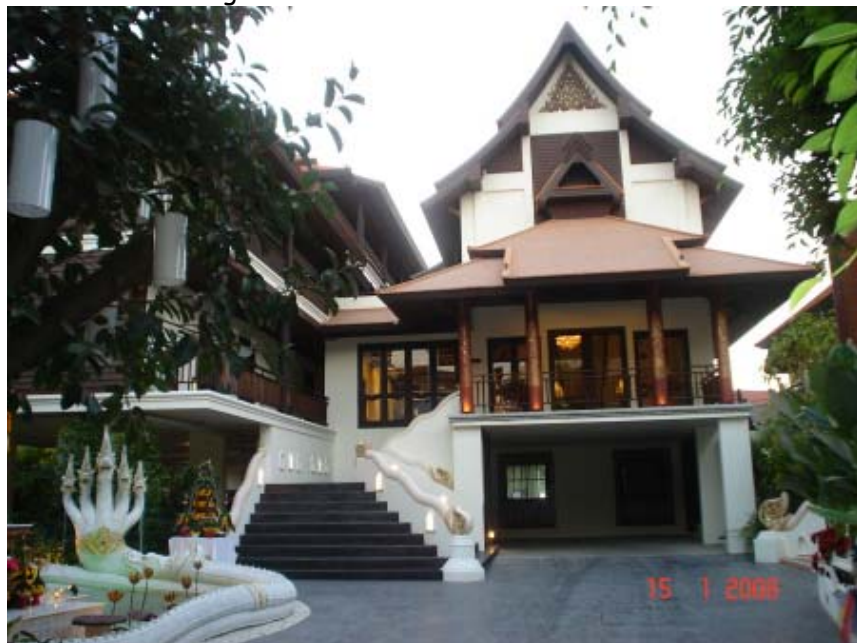
L'entrée du DeNaga